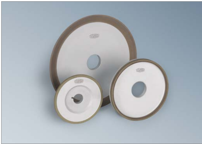
Diamant- und CBN-Schleifwerkzeuge

TYROLIT produziert ein umfangreiches Schleifwerkzeugsortiment für das Schleifen von Sägen und Kunststoffbearbeitungswerkzeugen. Es reicht von konventionellen Schleifscheiben bis zu Diamant und CBN Schleifwerkzeugen. Zusammen mit dem bewährten anwendungstechnischen Service liefert TYROLIT so spezifische Lösungen, die größtmöglichen Kundennutzen bieten.