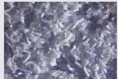
Schleifscheibenaufbau MIRA ICE