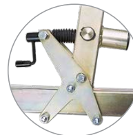
Seil lässt sich einfach einlegen und spannen