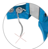
Indicateur de centrage intégré