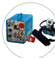
Unidad de control compacta y ligera, mando a distancia cómodo con pantalla

La WSE1621 ha sido diseñada para un uso universal y el uso diario en obra. Gracias a las funciones digitales y diseño compacto y ligero, este nuevo sistema diseñado, está sentando nuevos estándares y el corte mural. Montaje y desmontaje son realizados en un instante