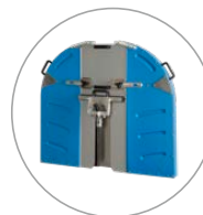
Ligero y robusto: Protector de disco