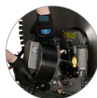
Montaje del motor sin herramientas