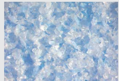
Structure de la surface de CSS ULTRA

Structure de la surface de CSS ULTRA avec un mélange de grains à base de corindon supérieur blanc et de liant fritté